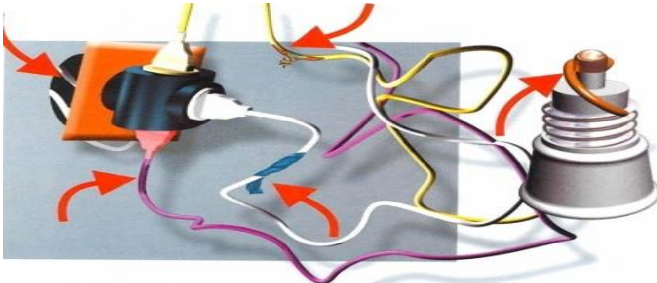
Безопасная эксплуатация электрооборудования.

Статистика показывает, что нарушение правил устройства и эксплуатации электрооборудования является одной из основных причин возникновения пожаров, в особенности зимой. Многие люди самостоятельно монтируют электрическую сеть, пользуясь некачественными и несоответствующими требованиям материалами