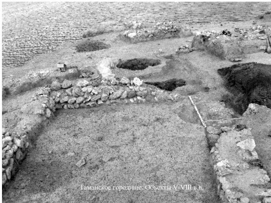
Таманское городище. Объекты V-VIII в.в.

Полувековая история раскопок средневековых слоев Таманского городища в 2006 г. увенчалась успехом. На одном из участков береговой линии на площади чуть более 100 кв.м. были частично открыты остатки трех крупных гончарных печей, в которых изготавливали амфоры и пифосы 2 в V-VII вв. для продажи населению округа Гермоны и другим городам Боспора. Доказательством тому, что открытые печи служили для обжига керамики, являются находки специальных подставок для обжига крупной керамики, а так же довольно высокий свод в одной из открытых печей. В другой открытой печи сохранились хорошо две обжигательные камеры, свод которых был сложен в виде арок из рваного округлой формы булыжника, перемежающегося с сырцовым кирпичом. Заполнение обжигательных камер было очень рыхлым, золистым.