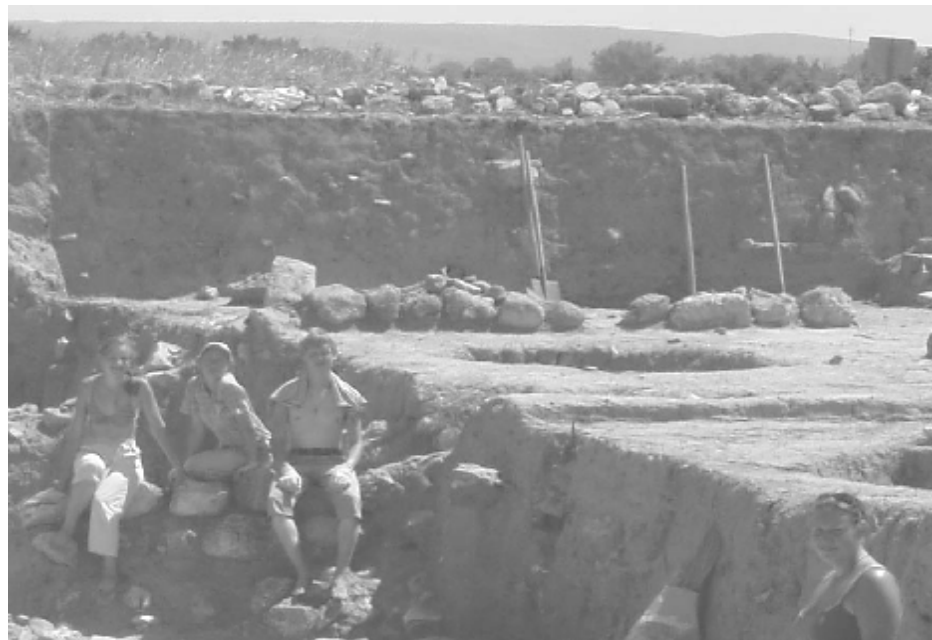
Студенты Московского Богословского университета на раскопках Тмутаракани

11 лет князь Олег-Михаил княжил в Тмутаракани. В слоях Таманского городища