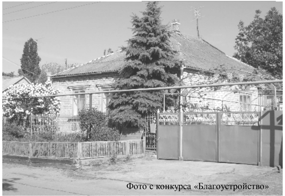
Фото с конкурса «Благоустройство»

В администрацию Таманского сельского поселения поступили деньги (500 т.р.) в виде субвенций из краевого бюджета по программе «Детские спортивные площадки». Общая сумма на строительство площадки составит 2,3 млн. руб. Доля краевого бюджета составит 1 млн. руб. Остальные деньги - вклад администрации Тамани.