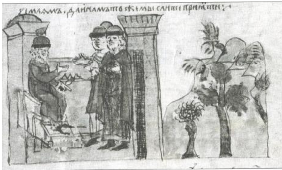
Беседа Владимира Святославича о вере иудейской с хазарскими евреями. Миниатюра из Радзивилловской летописи

К числу поворотных событий в русской истории, несомненно, относится принятие Русью христианства в 988 г. во время княжения Владимира Святославича. Крещению Руси предшествовали значительные события. Одно из них нашло отражение в знаменитом летописном сказании о «выборе веры», когда в 986 г. киевский князь, выслушав представителей ислама, христианства и иудаизма, должен был склониться в сторону одной из мировых религий. Однако выбор Владимира был заранее предопределен культурной и государственной ориентацией Древнерусского государства на Византию.